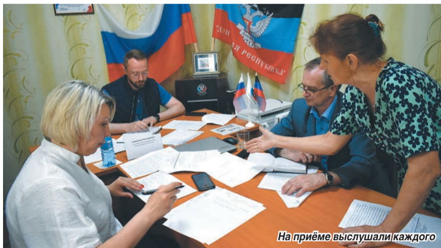
На приёме выслушали каждого

«Там, где в первую очередь необходимо провести локальный ямочный ремонт, будут выполнены аварийные работы. Все вопросы о необходимости восстановления дорог и искусственных сооружений, поднятые в ходе приема, не останутся без внимания. По местам будет проведена аналогичная работа: определены первоочередные проблемы и поставлены соответствующие задачи по их