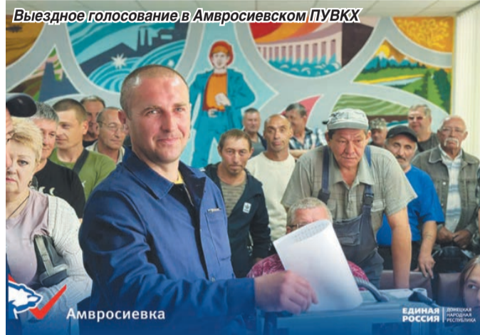
Выездное голосование в Амвросиевском ПУВКХ