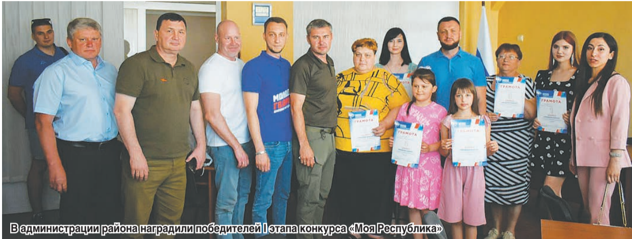
В администрации района наградили победителей I этапа конкурса «Моя Республика»

20 июня в торжественной обстановке в администрации Амвросиевского района наградили самых активных и талантливых жителей нашего района.