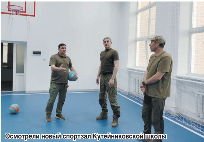
Осмотрели новый спортзал Кутейниковской школы