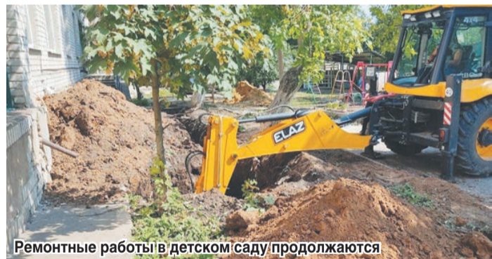
Ремонтные работы в детском саду продолжаются