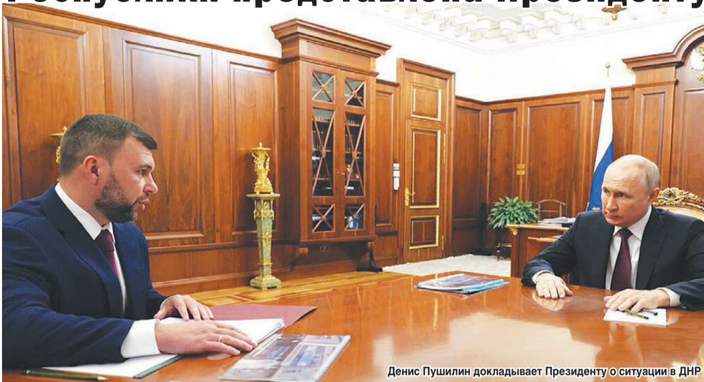
Денис Пушилин докладывает Президенту о ситуации в ДНР

На прошлой неделе в рамках второго этапа I Конференции Донецкого регионального отделения Всероссийской политической партии «Единая Россия» врио Главы ДНР Денис Пушилин представил Стратегию возрождения и развития Донецкой Народной Республики. По сути, это документ, согласно которому республика будет строить свою жизнь в ближайшие годы. При его разработке были максимально учтены пожелания жителей, интересы и потребности всех городов и районов. Программа получилась живой и по-настоящему народной.