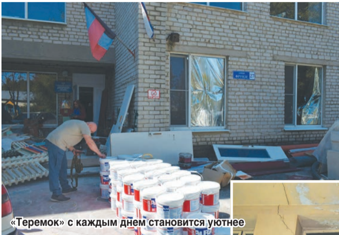
«Теремок» с каждым днем становится уютнее