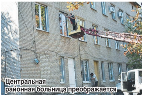
Центральная районная больница преобразуется