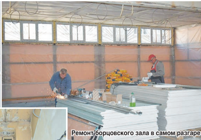
Ремонт борзовского зала в самом разгаре