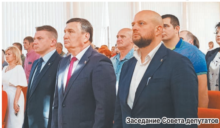
Заседание Совета депутатов