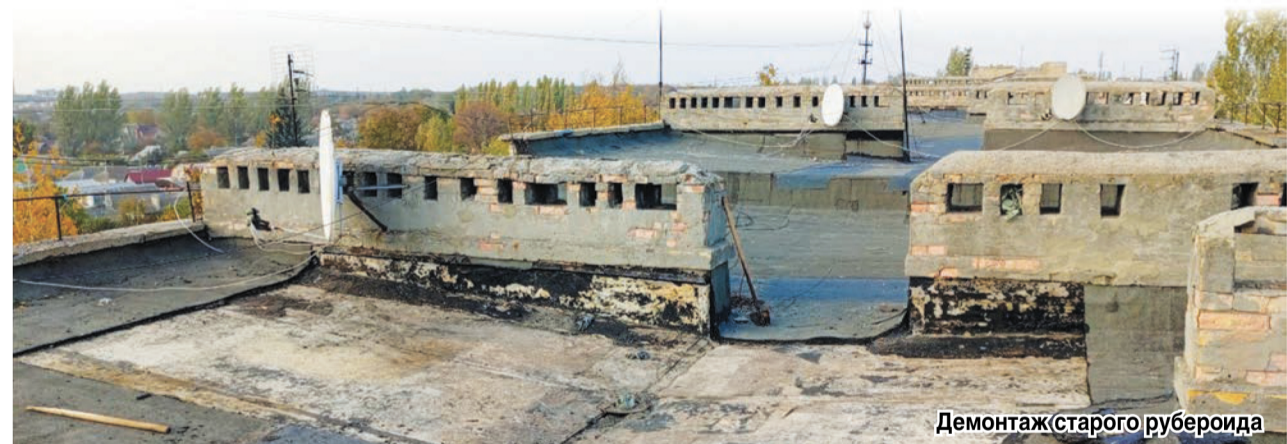
Демонтаж старого рубероида

«В общей сложности в ближайшее время запланированы работы по 18 многоквартирным домам. В планах ремонт кровли по адресам: ул. Фрунзе, 10, ул. Петровского, 63, а также дома по центральной улице Ленина. При этом сразу же отмечу, список объектов в дальнейшем будет пополняться. Объём работ, конечно, очень большой. Понимая, что ремонт кровли в многоквартирном жилом фонде не выполнялся десятилетиями, на перечисленных домах мы останавливаться не будем. Считаю, что хотя бы текущий ремонт, но надо выполнять на всех домах», – отметил руководитель предприятия.