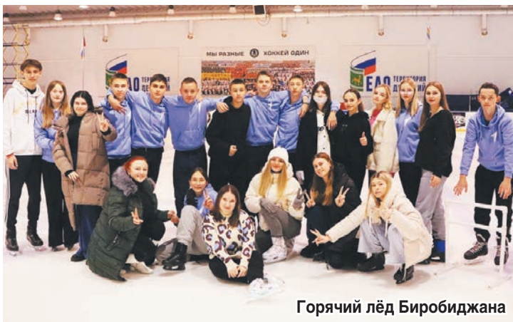
Горячий лёд Биробиджана

Понравилось общежитие, весь персонал, который был задействован с нами. Нас очень тепло встречали, всё время была дружелюбная атмосфера в общении. А когда нас провожали в обратный путь – это был очень эмоциональный момент, во время которого не все смогли сдержать слёзы. Благодаря нашим водителям мы не скучали ни минуты, даже в общежитии. Спасибо всем за эту поездку.