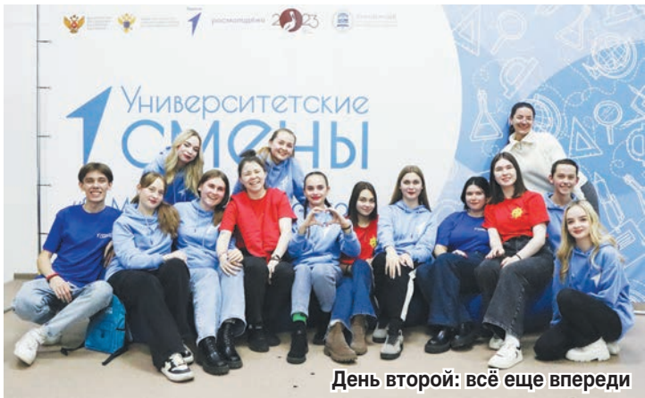
День второй: всё ещё впереди

В прошлых номерах нашей газеты мы рассказывали читателям о поездке школьников Амвросиевского района в Еврейскую автономную область, в рамках проекта «Университетские смены». А сегодня своими впечатлениями о путешествии решили поделиться учащиеся школы № 4. Напомним, что именно в этом учебном заведении усилиями региона-шефа ЕАО появился образовательный центр «Точка роста».