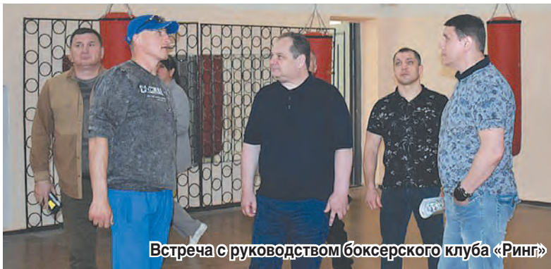
Встреча с руководством боксерского клуба «Ринг»